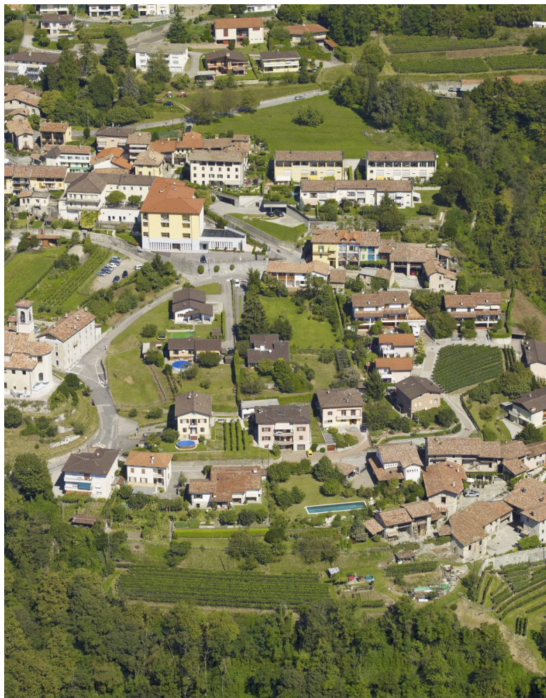
Moltiplicatore comunale: 65 %

Castel San Pietro risulta un comune attrattivo dal punto di vista fiscale: grazie al suo 55%, è stato il comune con il miglior moltiplicatore fiscale di tutto il Ticino (dal 2025 il moltiplicatore è ora del 65%, tra i migliori della regione).