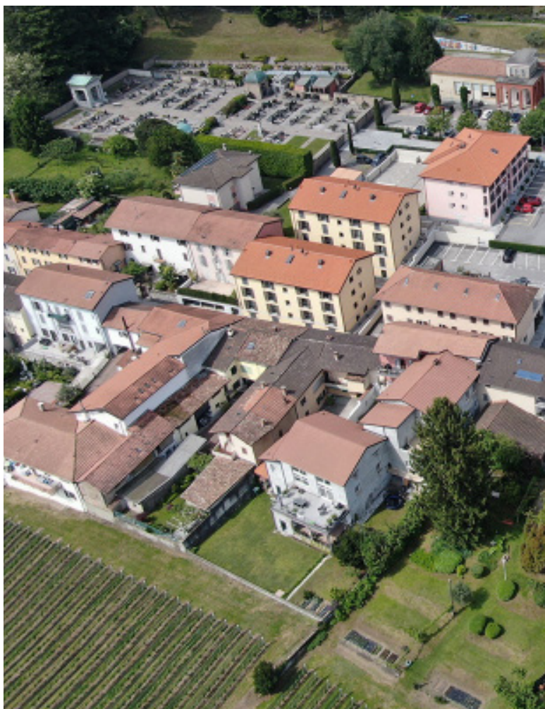
Moltiplicatore comunale: 65 %

E' la soluzione perfetta per chi desidera godere della comodità di servizi ed infrastrutture, senza rinunciare alla tranquillità ed al contatto con la natura